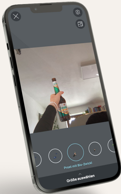
sharepic.eu oder Deep-Link öffnen